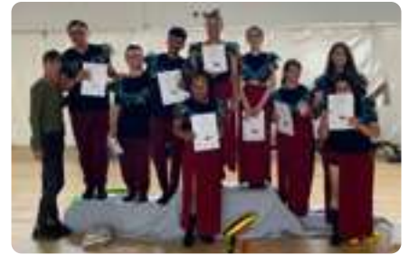
Concurso de Baile Alcalá Groove