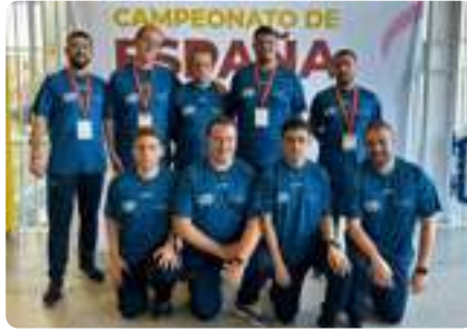
CAMPEONATO ESPAÑA de Baloncesto (Alcalá de Henares, Madrid)