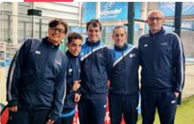
Torneo Más que Pádel en Zaragoza