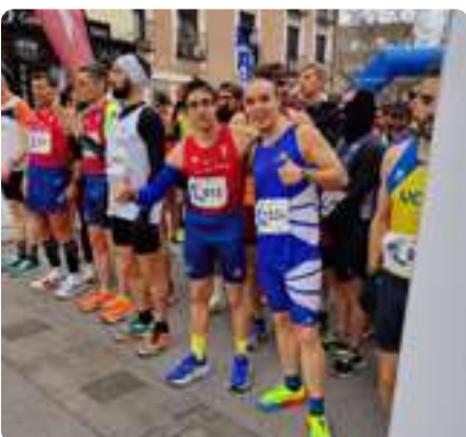
Media Maratón de Fuencarral