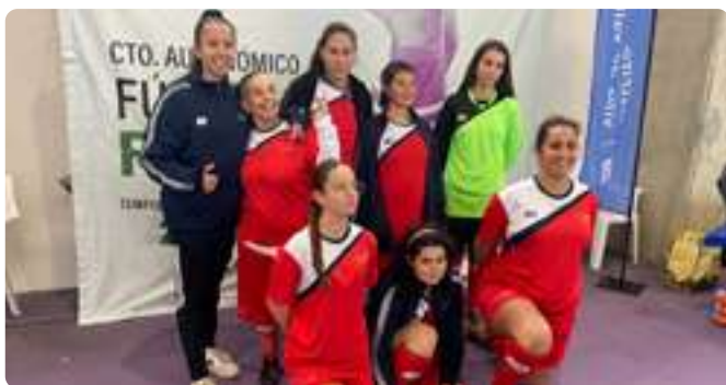
Liga de Fútbol Femenino