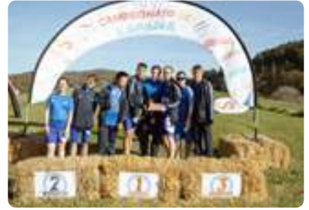
CAMPEONATO ESPAÑA de Campo a Través (Bilbao)