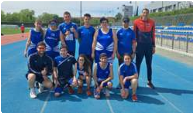
Circuito Autonómico de Atletismo