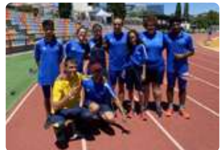
CAMPEONATO ESPAÑA de Atletismo Adaptado (Alcobendas)