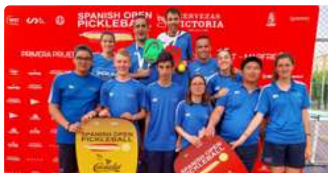
Spanish Open Pickleball