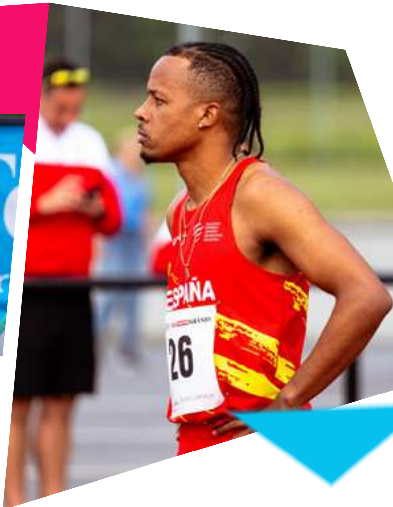
CAMPEONATO DE EUROPA DE ATLETISMO UPPSALA • SUECIA 2024