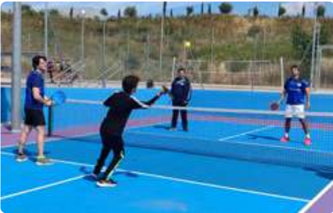
Pickleball Inclusivo BBVA