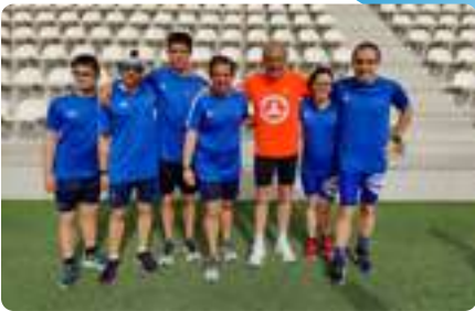
Disfriendly Maratón de Madrid