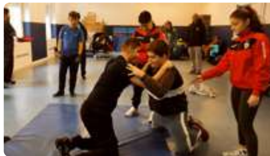
Promoción de Lucha