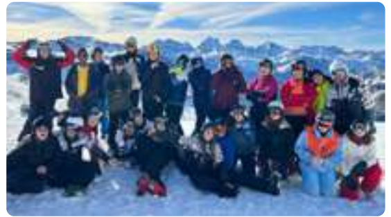
IX Curso de Esquí