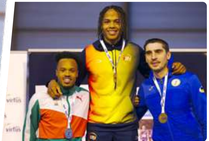
CAMPEONATO DEL MUNDO EN PISTA CUBIERTA VIRTUS 2024