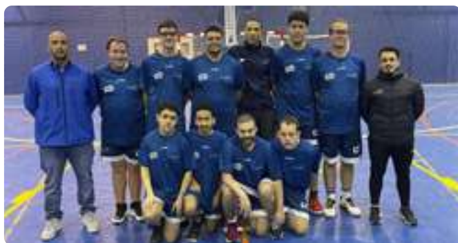
Liga de Baloncesto