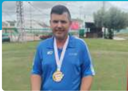
CAMPEONATO ESPAÑA de Golf (Torrepacheco, Murcia)