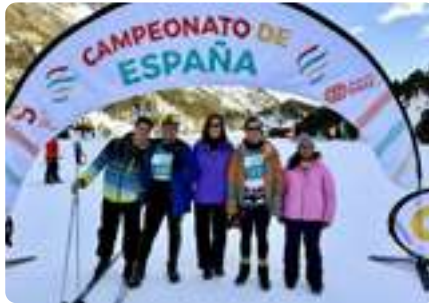
CAMPEONATO ESPAÑA de Esquí Nórdico (Huesca)