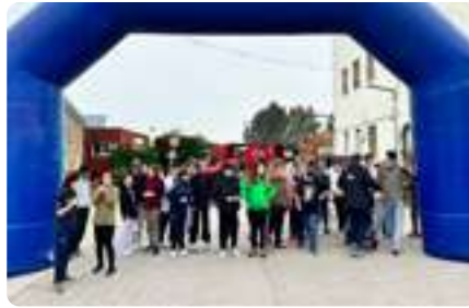
Carrera Buenas Costumbres