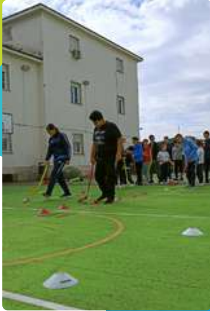
Intercentros Hockey Escolar