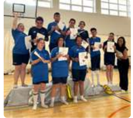
Exhibición de Zumba