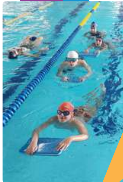
Picina en la Masó - Mucho más que natación