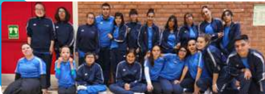
Exhibición Zumba Alcobendas