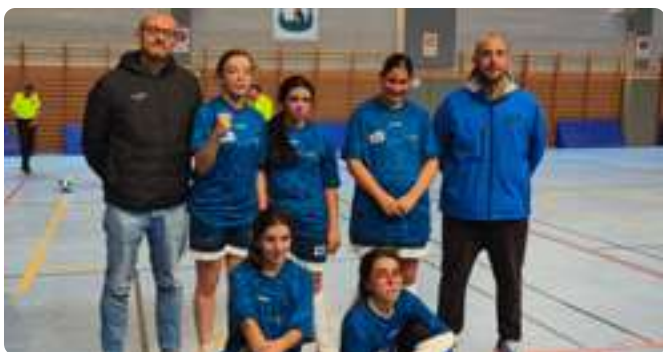
Liga de Baloncesto Femenino