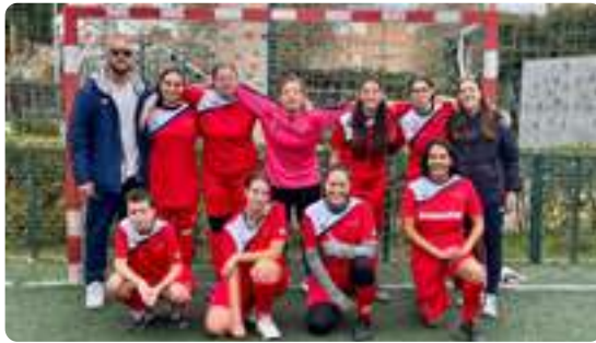
Copa Autonómica de Fútbol 5