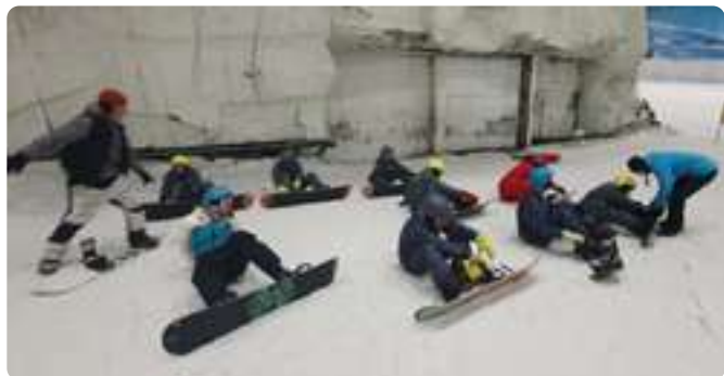
Sesión de Snow en Xanadú