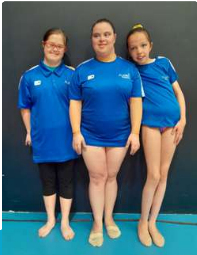
Campeonato Autonómico de Gimnasia Rítmica