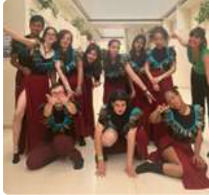
Concurso de Baile Argandance