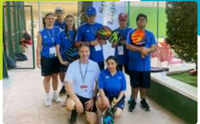
Torneo Nacional de Pádel en Castellón