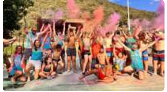
Campamento de Verano