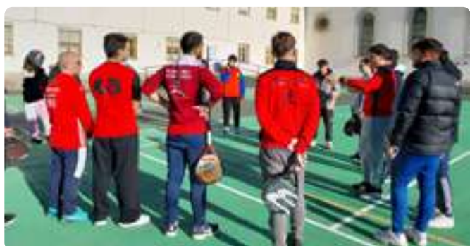
Visita Estudiantes TSEA FP Guzmán el Bueno