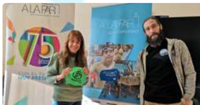
Convenio CN Marlins Moratalaz