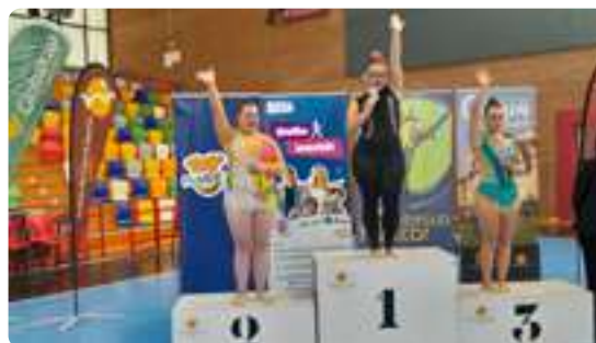
Torneo Gimnasia Rítmica en Cuenca