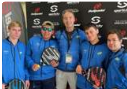
CAMPEONATO ESPAÑA de Pádel (Valencia)