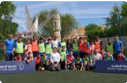
Evento Fundación LAUREUS