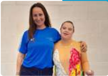
CAMPEONATO ESPAÑA de Gimnasia Rítmica (Elche, Alicante)