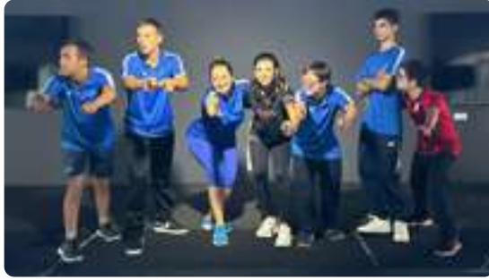
Aniversario GOfit Montecarmelo