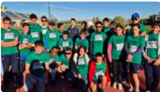
Jornada de Atletismo Inclusivo Fuencarral