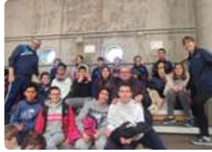
Evento de Control Postural