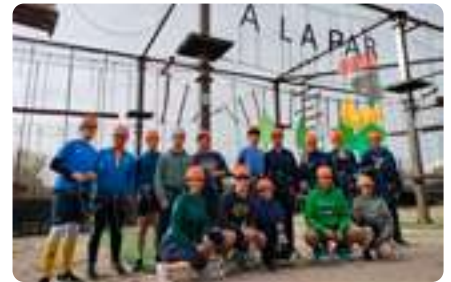
Jornada deportiva con Bankinter