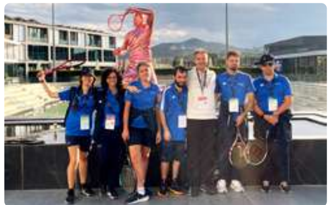
Torneo Más que Tenis (Manacor, Mallorca)