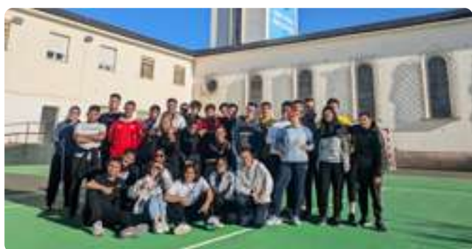
Visita Estudiantes TSEAS FP San Ignacio de Loyola