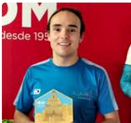
Media Maratón de Madrid