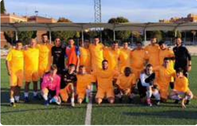
Liga Fútbol 7 Unificado