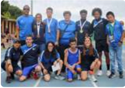
CAMPEONATO ESPAÑA Atletismo (Valencia)