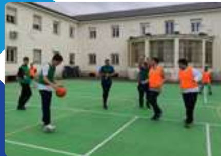
Liga de Baloncesto Escolar