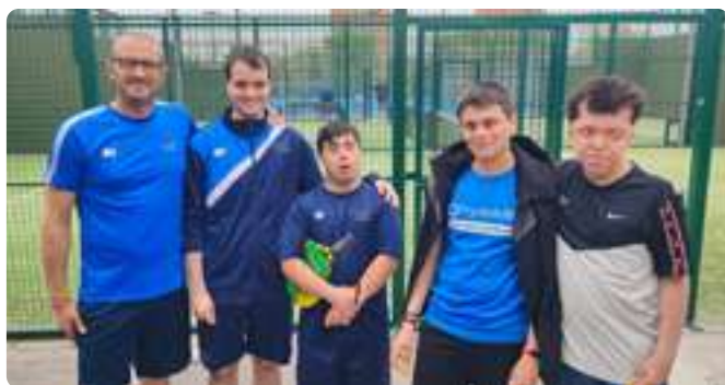
Liga de Pádel