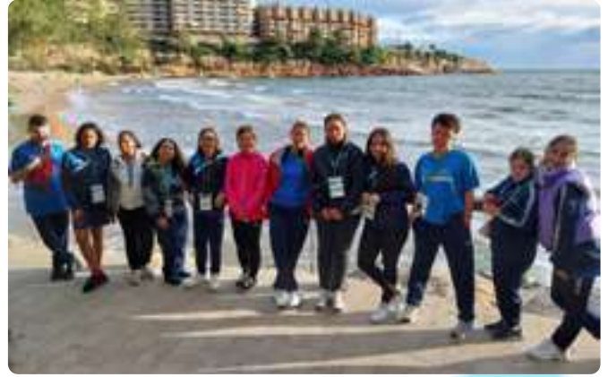
Meeting Internacional Reus 2024