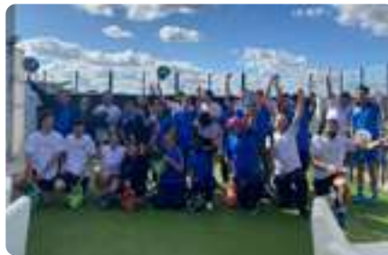
Pádel Inclusivo con Iberia