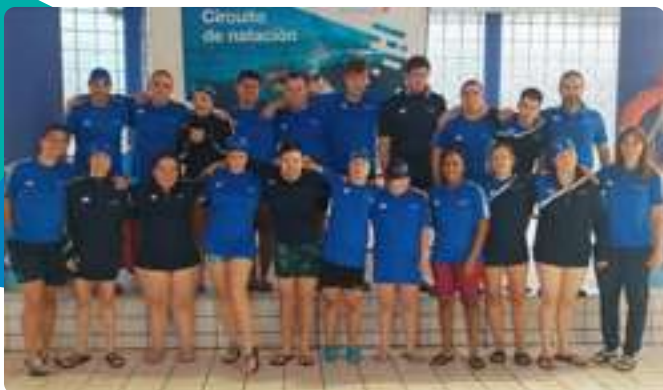
Circuito Autonómico de Natación