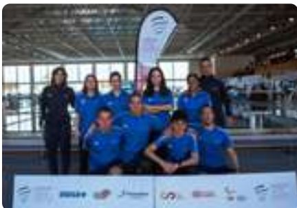
CAMPEONATO ESPAÑA de Natación (Málaga)