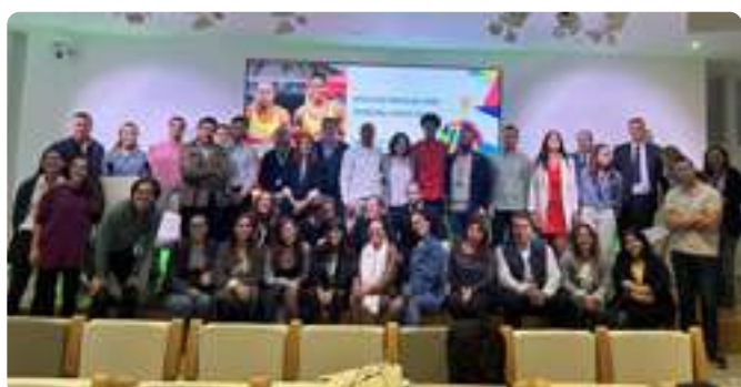
Charla de Paralímpicos en BNP Paribás