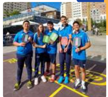
Pickleball en Plaza de España