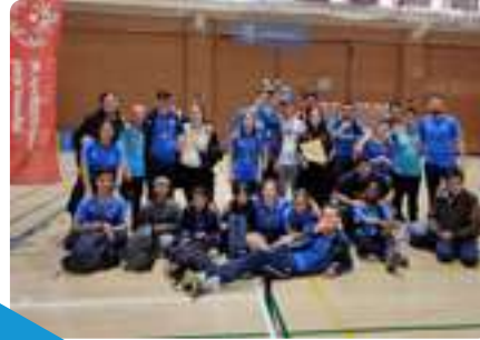
Evento Final Deporte Escolar Adaptado